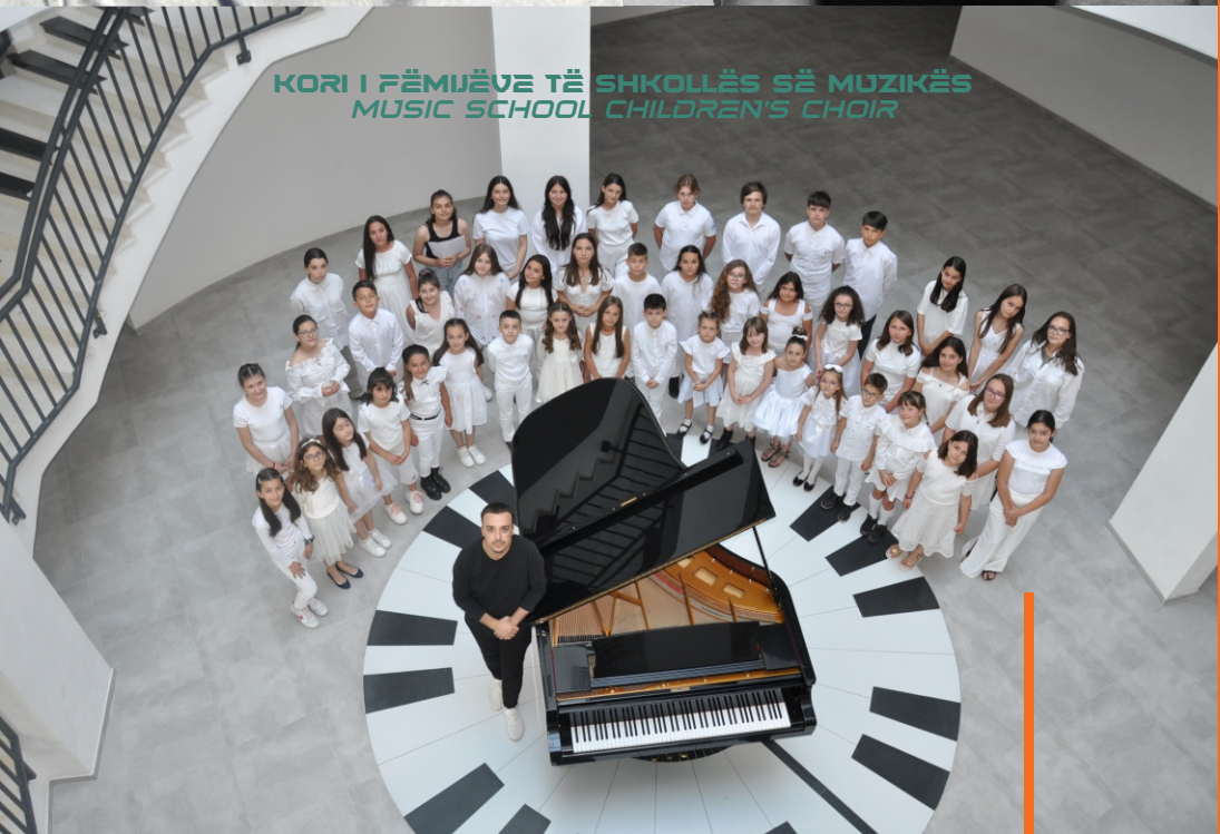
KORI I FËMËJËVE TË SHKOLLËS SË MUZIKËS MUSIC SCHOOL CHILDREN'S CHOIR